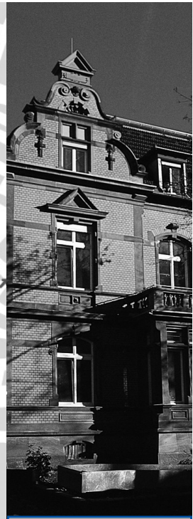
Liefmannhaus, Goethestr. 33