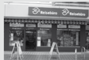
Rosenstr. 24 | 79211 Denzlingen Telefon 07666 / 91 12 30