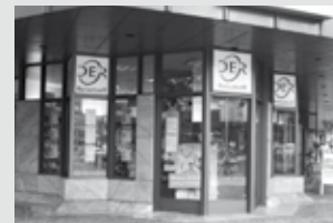
Bismarckallee 10 | 79098 Freiburg Telefon 0761 / 38 77 80