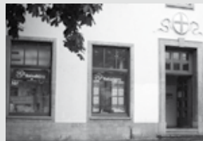
Rotteckring 14 | 79098 Freiburg Telefon 0761 / 31 90 10